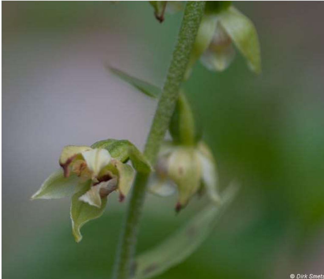
kleine bloem (1 cm), niet wijdgepend; blad geelgroen, gegolfde rand