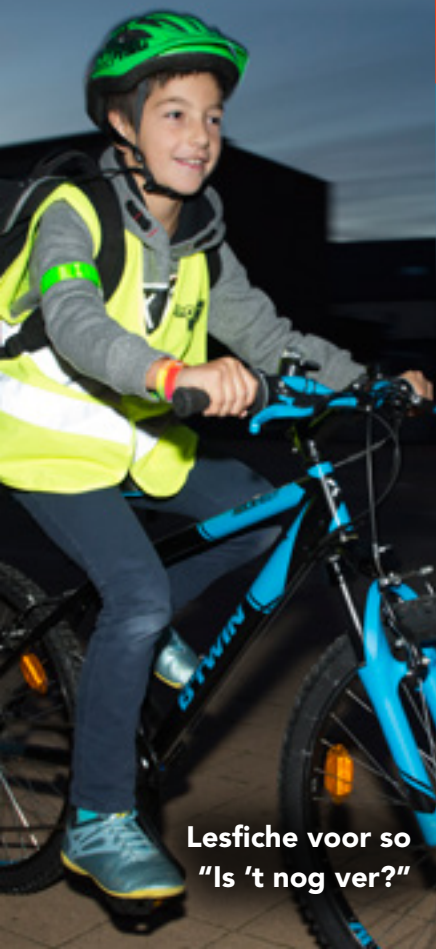
Lesfiche voor so "Is 't nog ver?"