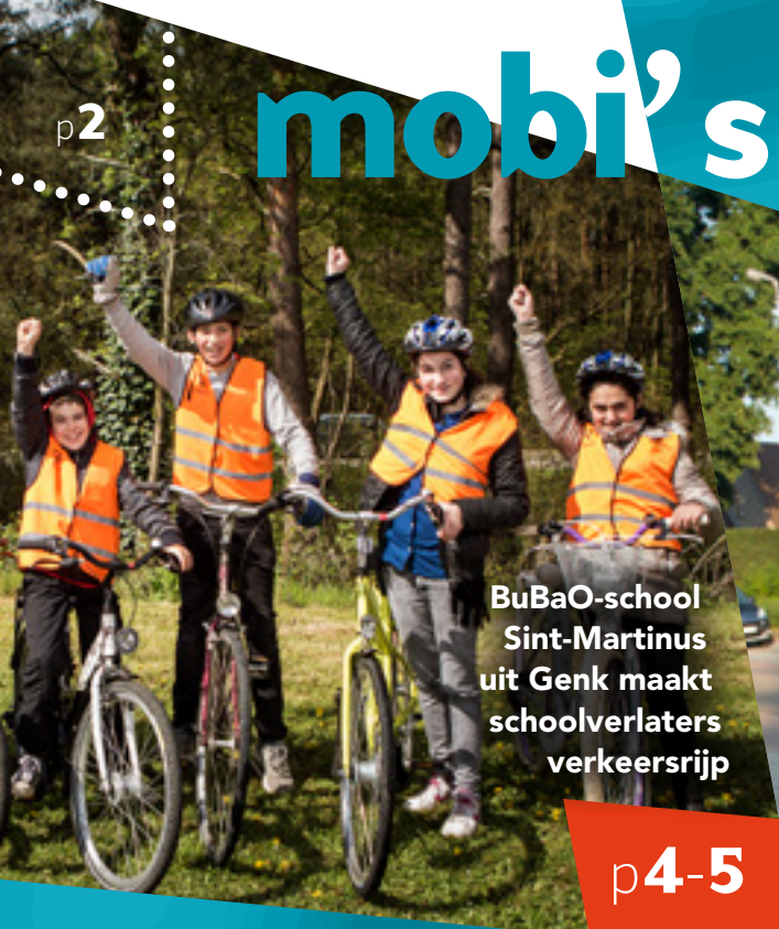
BuBaO-school Sint-Martinus uit Genk maakt schoolverlaters verkeersrijp