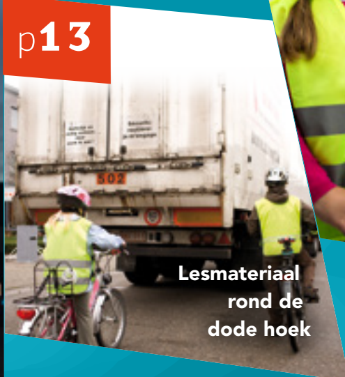
Lesmateriaal rond de dode hoek