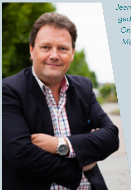
Jean-Paul Peuskens, gedeputeerde van Onderwijs en Mobiliteit