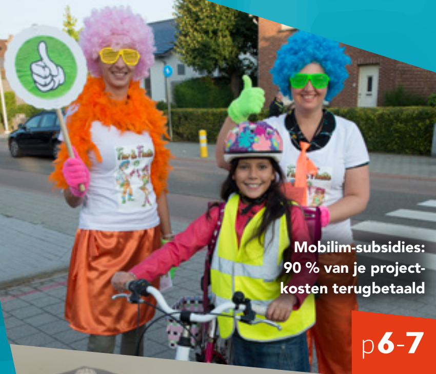
Mobilim-subsidies: 90 % van je projectkosten terugbetaald