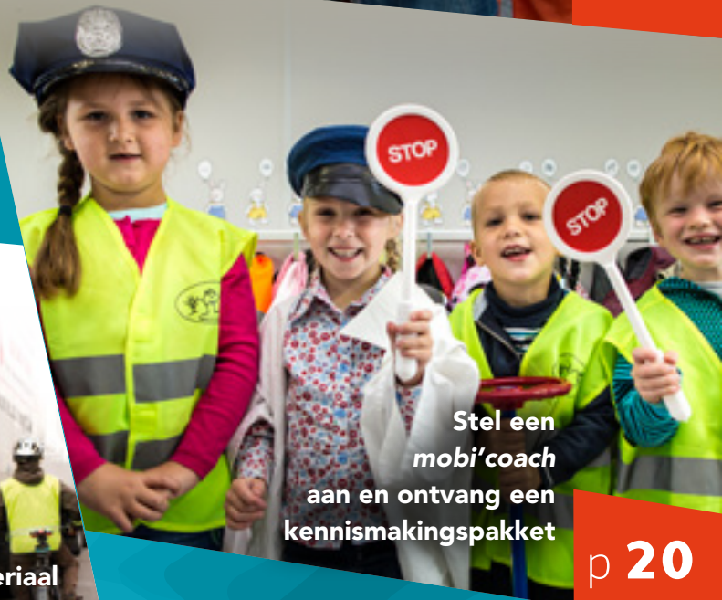
Stel een mobi'coach aan en ontvang een kennismakingspakket